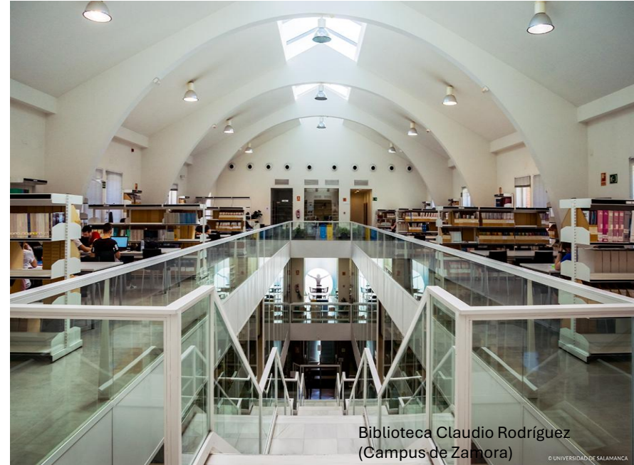
Biblioteca Claudio Rodríguez (Campus de Zamora)

Pruebas teóricas (50%), actividades prácticas (15%) y trabajo final (35%).