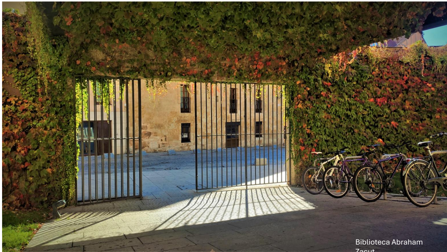
Biblioteca Abraham Zacut