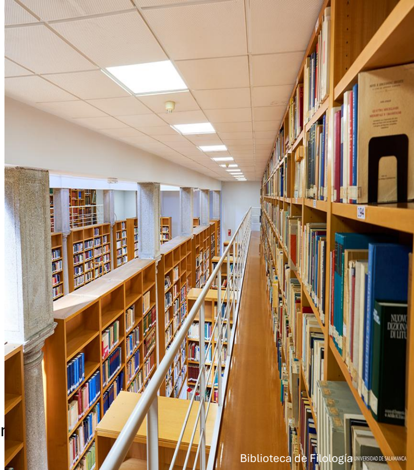
Biblioteca de Filología UNIVERSIDAD DE SALAMANCA