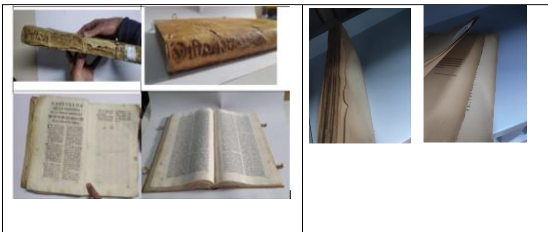
Ejemplo de libro antiguo

Se comenzó entonces, de forma puntual, la adquisición de cajas de conservación según la medida exacta de los libros, así como a contactar con empresas de restauración. De esta forma confirmamos que el proceso de acidez no es reversible y que la mayor parte de los libros que la sufren en esta biblioteca están destinados a desaparecer porque no se podía hacer una desacidificación masiva. Es decir, comenzamos a plantearnos, por una parte, la importancia de conservar el contenido científico a través de la digitalización de más de 3.000 libros con papel ácido, y por otra, a ver la necesidad de digitalizar y, posteriormente a restaurar otras obras por su valor como objetos patrimoniales.