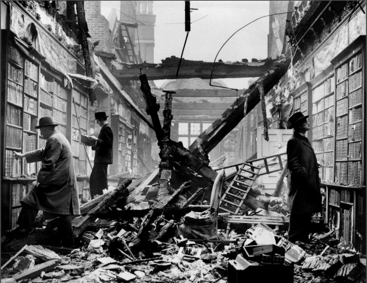
Restos de la Holland House Library (Londres), tras sufrir un bombardeo en 1940.