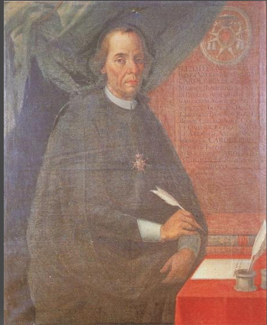
Retrato de Francisco Pérez Bayer. Anónimo (Madrid. BNE, Inventario).