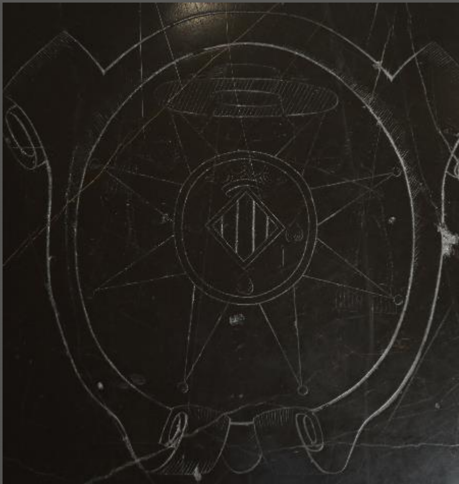
Lápida de la tumba de Francisco Pérez Bayer, capilla de santo Tomás de Villanueva (Catedral de Valencia).