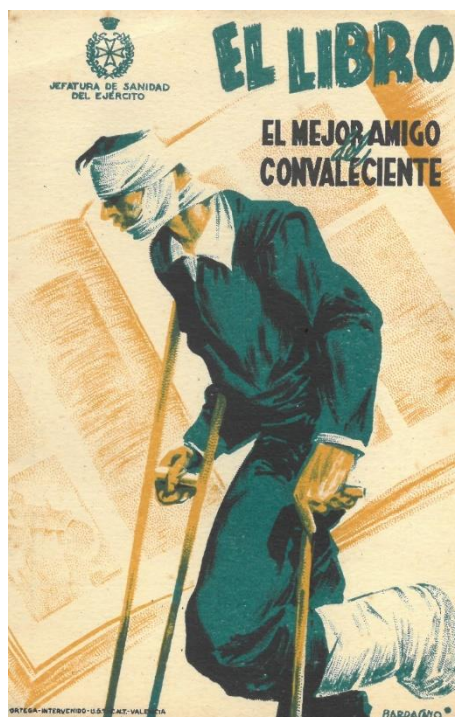
Figura 2: Cartel de la Jefatura de Sanidad del Ejército para incentivar la lectura entre los soldados

Paralelamente, en Cataluña el gobierno de la Generalitat, a través del director de la Biblioteca de Catalunya Jordi Rubió i Balaguer, creó el Servei de Biblioteques del Front , con el fin de llevar libros y revistas a los combatientes.