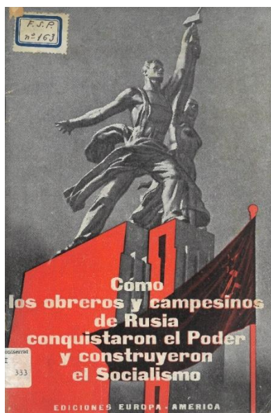
Figura 4: Libro de la Editorial Europa-América, con un diseño de estética soviética

Otro sello editorial presente es Europa-América , que publicaba obras marxistas y comunistas y de literatura revolucionaria, mayoritariamente en español. También hay obras de Ediciones Españolas que junto con la editorial Nuestro Pueblo , se convirtieron en las editoriales más importantes de la zona republicana (Martínez Rus, 2023, p. 130).