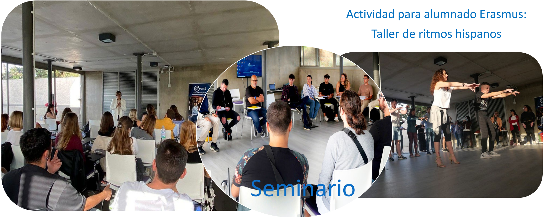
Actividad para alumnado Erasmus: Las variedades del español: vocabulario y música