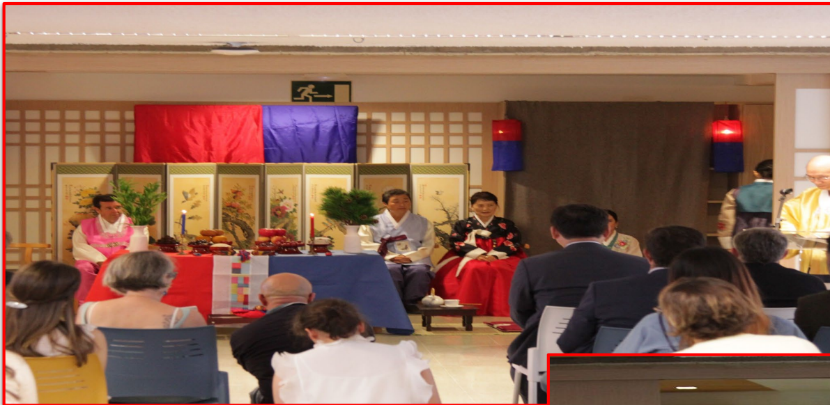
Boda tradicional coreana