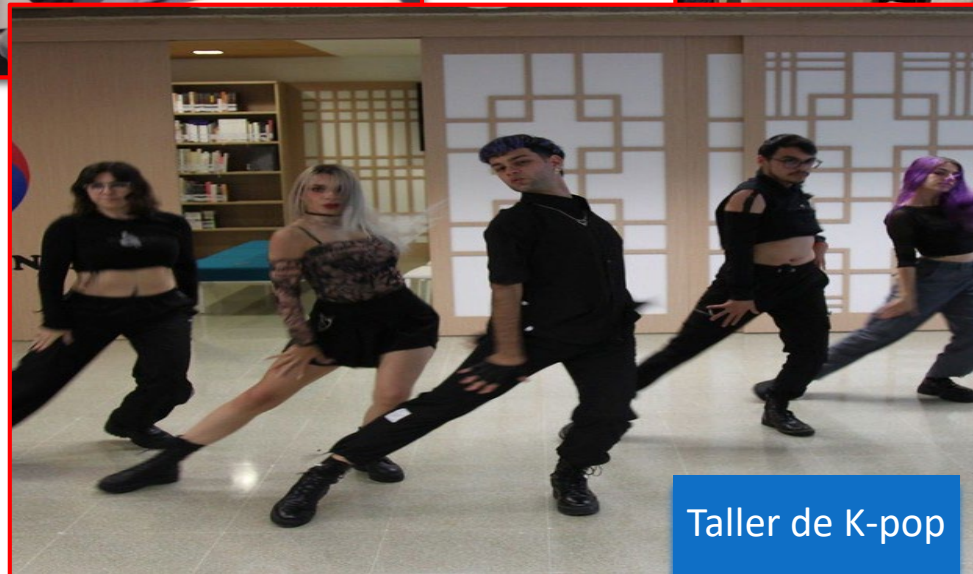
Taller de K-pop