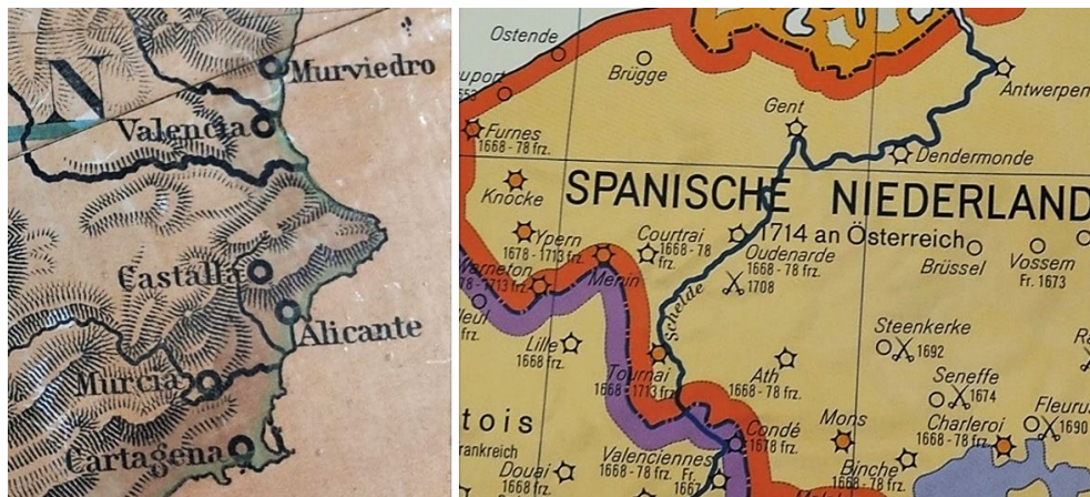
Figuras 2 y 3. Mapa mural del S.XIX y mapa mural de la década de 1960, donde se muestran los distintos elementos de composición.

En los mapas históricos, la evolución es parecida: los publicados durante el XIX no se diferencian apenas de los mapas geográficos, salvo en que la toponimia es la pertinente al período o espacio histórico reflejado. Posteriormente se usarían colores, flechas, sobrecargas (rayados, etc.), símbolos para batallas o nombres de dinastías para aportar más información y hacerlos más dinámicos.