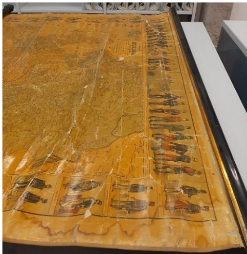
Figura 4. Mapa mural del S.XIX con distintos desperfectos

Diagnóstico de la Obra de Arte (LANDIAR) de la misma facultad, a través de la convocatoria de becas de prácticas entre el alumnado del Máster de Patrimonio de la UV. Esta fórmula ya había sido ensayada con éxito en años anteriores para la intervención de otros fondos de la Cartoteca. Las becas comenzaron a convocarse en junio de 2022. En ellas, mediante una intervención en seco, se realizan todas las labores de limpieza y consolidación necesarias.