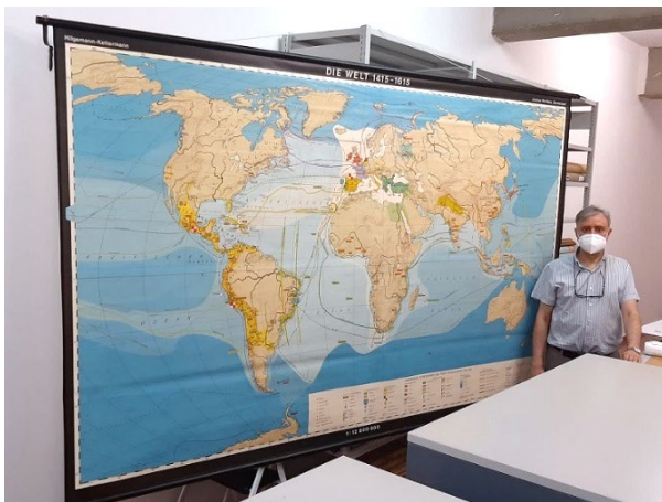
Figura 1. Mapa mural extendido

El formato. Son mapas de gran tamaño, con hasta varios metros de lado, editados en varias hojas, que se entelaban para montarlos y a los que se añadían listones en su parte superior e inferior para poder fijarlos en las paredes y colgar o descolgar a conveniencia. En cuanto a su impresión, fueron usados los distintos sistemas que aparecieron durante estos años: de la litografía al offset o incluso a materiales plásticos.