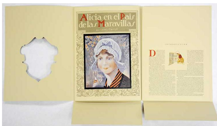
Figura 3. Detalle de encuadernación de Alicia en el País de las Maravillas . Servicio de Publicaciones UCLM, 2015.

se trata de ediciones quasi facsimilares ), se han adaptado a las características del álbum ilustrado actual. Queremos destacar la introducción de guardas ilustradas 4 a partir de la reproducción en 2005 de La hormiguita se quiere casar , generalmente a partir de la repetición de un motivo relacionado con alguna ilustración del original. Todas estas ediciones suelen realizarse con encuadernación en tapa dura (no necesariamente coincidente con el original), para garantizar la mejor preservación y presentación de la edición facsimilar contenida en el corpus del libro. Si bien es cierto que, en este apartado, el proyecto editorial de cada título se ha ido adaptando al mejor producto final considerando las características propias del original reproducido, y su puesta a disposición del público (i.e.: Alicia en el País de las Maravillas ).