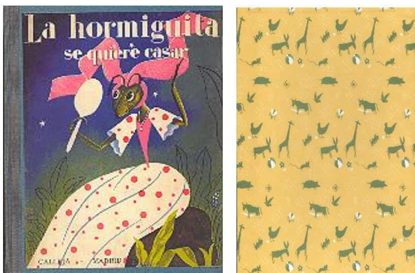
Figura 2. Cubierta y guarda de La hormiguita se quiere casar . Servicio de Publicaciones UCLM, 2005.

Desde entonces se han recuperado un total de catorce títulos (Anexo 1) entre los que se encuentran algunos que han “sufrido” parecidas situaciones: Polilla y la pizarra del rey Melchor , nuestra Alicia en el país de las maravillas , Navidad: villancicos, pastorelas, posadas, piñatas 3 , entre otros; y cuyos estudios previos de carácter introductorio, a cargo de especialistas en la materia, han sido de enorme utilidad a la crítica literaria especializada, y al público amante de la LIJ más clásico, a la hora de reivindicar sus textos, autores, ilustradores y editoriales primigenias.