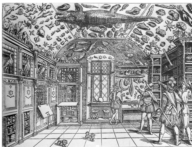
Figura 3. “ Ritrato del museo ” de Ferrante Imperato (1599)

había libros, objetos no menos curiosos o raros que otras piezas de naturalia o de la creación humana. Los libros mexicanos o los libros chinos, por ejemplo, fueron piezas codiciadas por su exótica procedencia, pero nos resultará casi imposible localizarlos en los cuadros de Jan Van Kessel, el viejo, o de otros artistas de la época que reproducen estas estancias. Y la razón no era otra que la misma que ahora dificulta las exposiciones sobre patrimonio bibliográfico o con libros. Si se observa con detenimiento un grabado napolitano de 1599, en el que se ofrece el “ ritrato del museo ” de Ferrante Imperato, el espectador actual verá, sin duda, una sala repleta de animales disecados, aves, crustáceos y réptiles especialmente. Sin embargo, al lado derecho hay una estantería, casi oculta tras los afortunados visitantes de la sala, que aparece repleta de libros, tumbados la mayor parte de ellos. Probablemente eran obras de botánica y de zoología, que conformaban una biblioteca auxiliar para el estudio de los animales 3 .