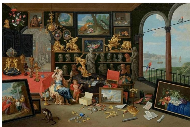
Figura 2. Jan Van Kessel el viejo. An Allegory of Sight (circa 1660)

Las representaciones pictóricas y gráficas de la época (siglos XVI al XVIII), suelen mostrar una clara tendencia por exhibir los objetos de una manera abigarrada, a veces sin un orden aparente, y con una cierta evidencia de que los propietarios padecían horror vacui . Era, no obstante, un desorden aparente, muy barroco, que buscaba impresionar al visitante. Los propietarios catalogaban con esmero sus colecciones y, en algunos casos, no se limitaban a plasmar su riqueza en una tabla o lienzo, sino que, como hiciera el naturalista y farmacéutico Albertus Seba, publicaban un catálogo. Nos referimos a su Locupletissimi Rerum Naturalium Thesauri (1734), donde sus curiosidades quedaron registradas de manera minuciosa en una obra de cuatro grandes volúmenes ilustrados.