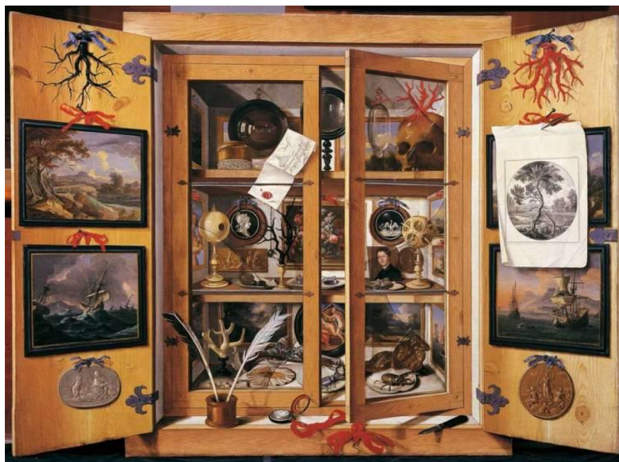
Figura 1. Gabinete de curiosidades, por Domenico Remps (circa. 1690)

Las representaciones pictóricas y gráficas de la época (siglos XVI al XVIII), suelen mostrar una clara tendencia por exhibir los objetos de una manera abigarrada, a veces sin un orden aparente, y con una cierta evidencia de que los propietarios padecían horror vacui . Era, no obstante, un desorden aparente, muy barroco, que buscaba impresionar al visitante. Los propietarios catalogaban con esmero sus colecciones y, en algunos casos, no se limitaban a plasmar su riqueza en una tabla o lienzo, sino que, como hiciera el naturalista y farmacéutico Albertus Seba, publicaban un catálogo. Nos referimos a su Locupletissimi Rerum Naturalium Thesauri (1734), donde sus curiosidades quedaron registradas de manera minuciosa en una obra de cuatro grandes volúmenes ilustrados.