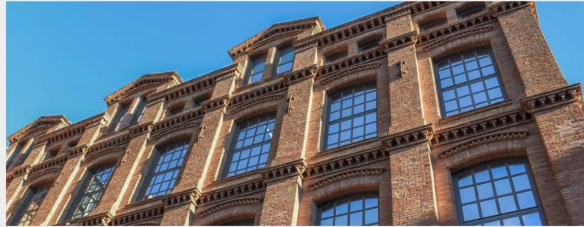
Biblioteca/CRAI del Poblenou