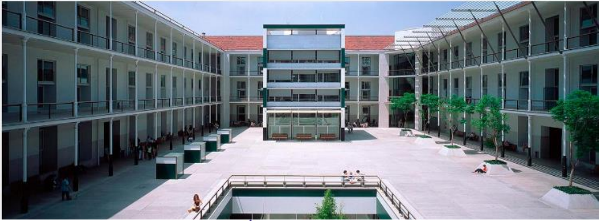
Biblioteca/CRAI de la Ciutadella