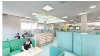
Infografía 1. Estado Reformado - CRA/ UJA