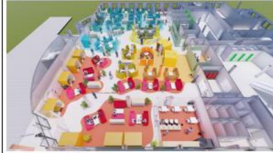
Infografía 4. Estado Reformado - CRA/ UJA