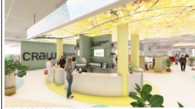
Infografía 2. Estado Reformado - CRA/ UJA