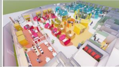
Infografía 5. Estado Reformado - CRA/ UJA