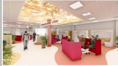
Infografía 3. Estado Reformado - CRA/ UJA