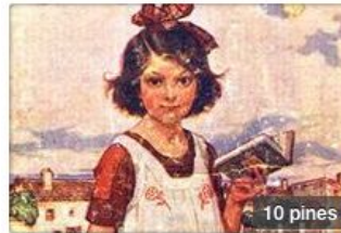
Exposiciones realizadas en I...