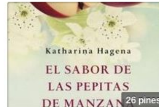
Libros Día del Libro 2013